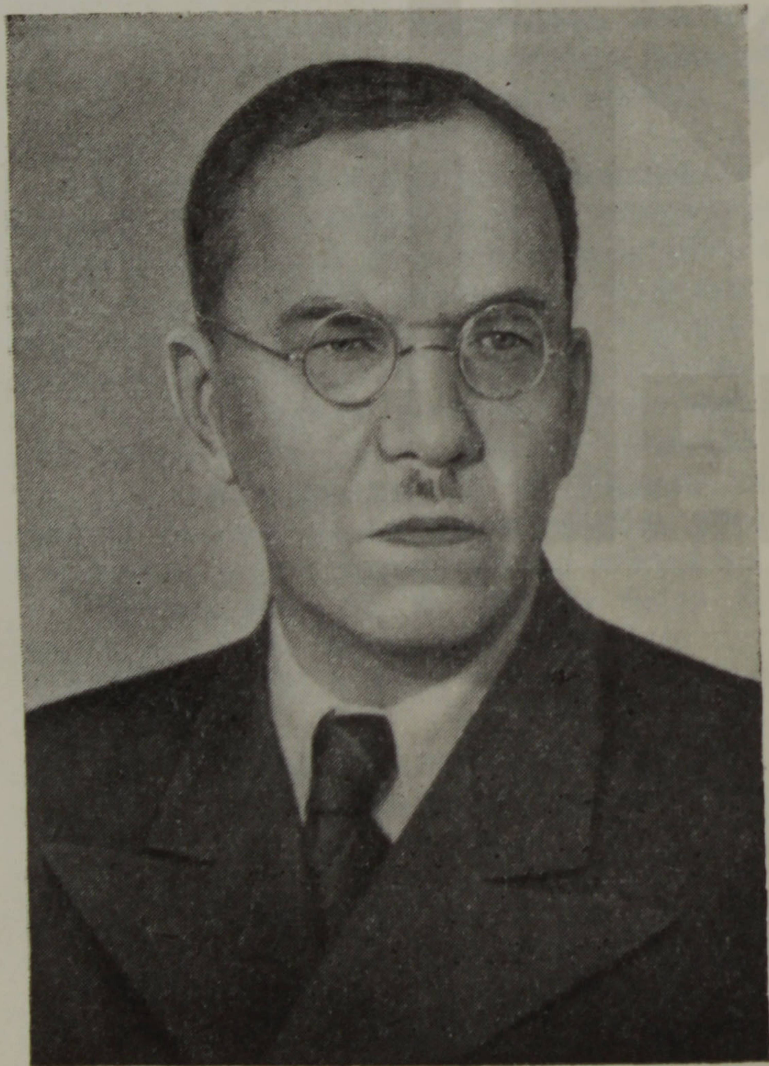
Академик М. Н. Тихомиров