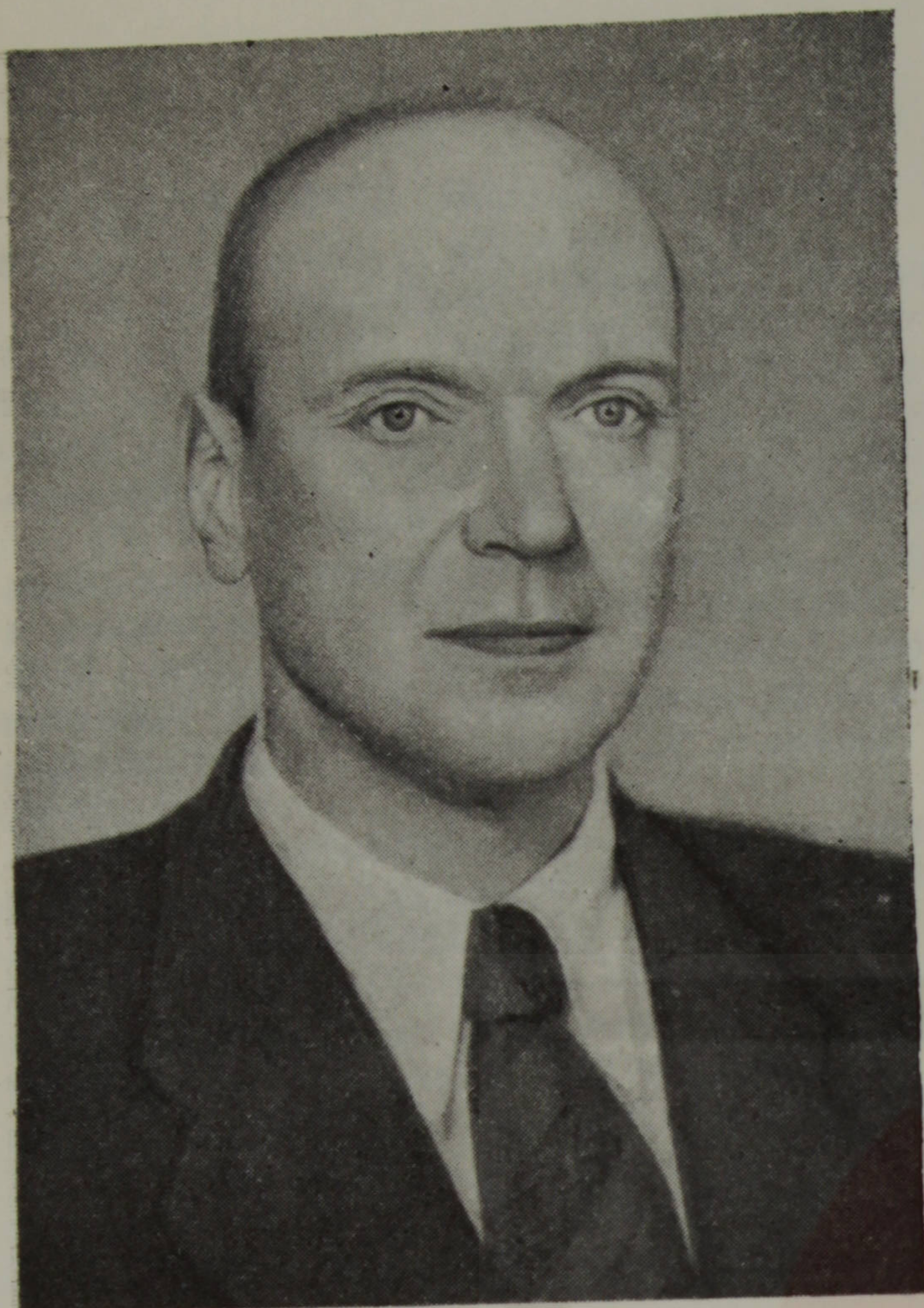
Академик Д. С. Коржинский