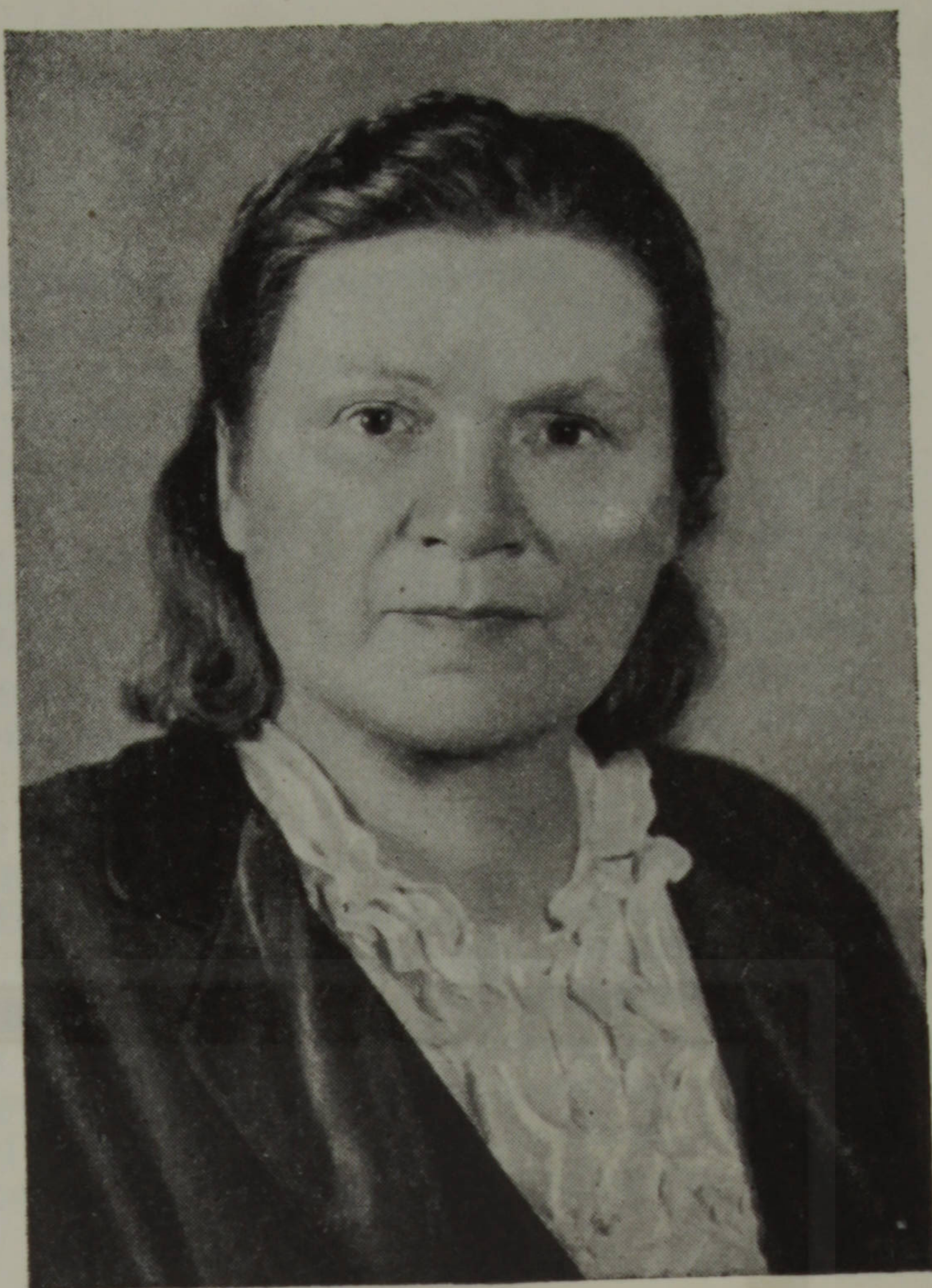
Академик А. М. Панкратова