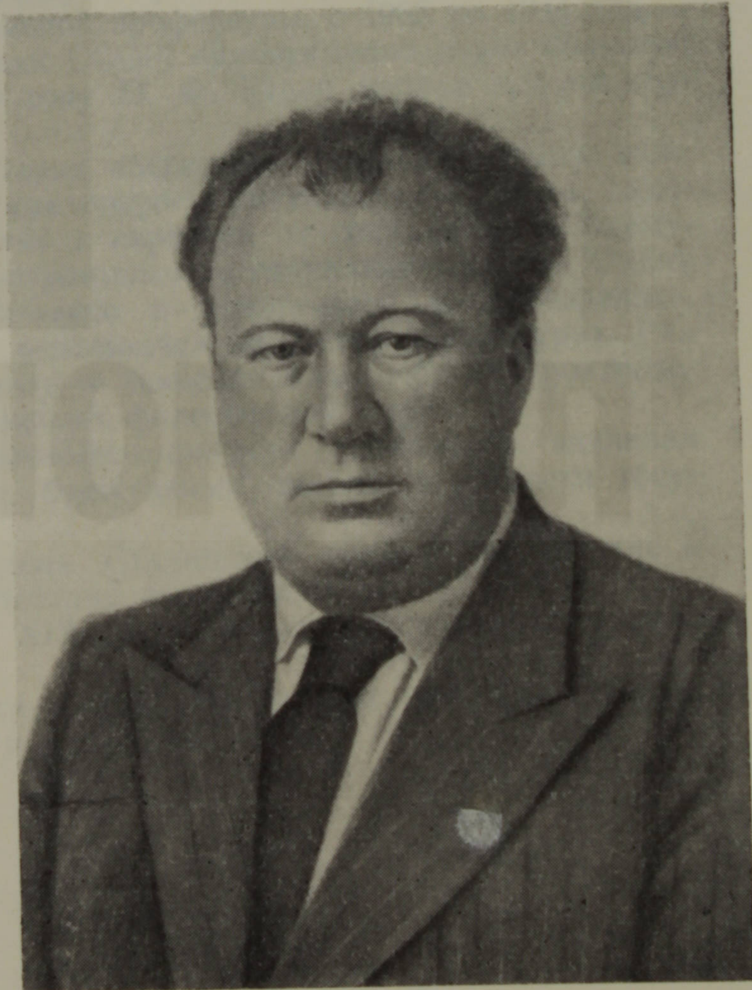
Академик П. Ф. Юдин

емиком где до ессора, 7 года избран жения Разра- олило емной рочно нези- нису рхей у за При- суж- Гру-